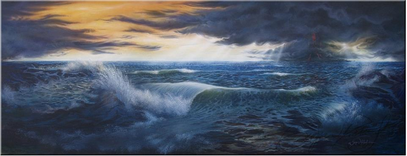
Après la tempête/After the storm, 2005 Acrylique sur bois, 36" x 52" (Collection privée)

Les années 2000 marquent un virage vers l'abstrait et une approche plus intuitive de la création. En photographie, j'explore les paysages, les ambiances atmosphériques ainsi que le microcosme et le macrocosme de nos forêts. Je documente régulièrement ce qui se présente devant moi dans l'instant du moment.