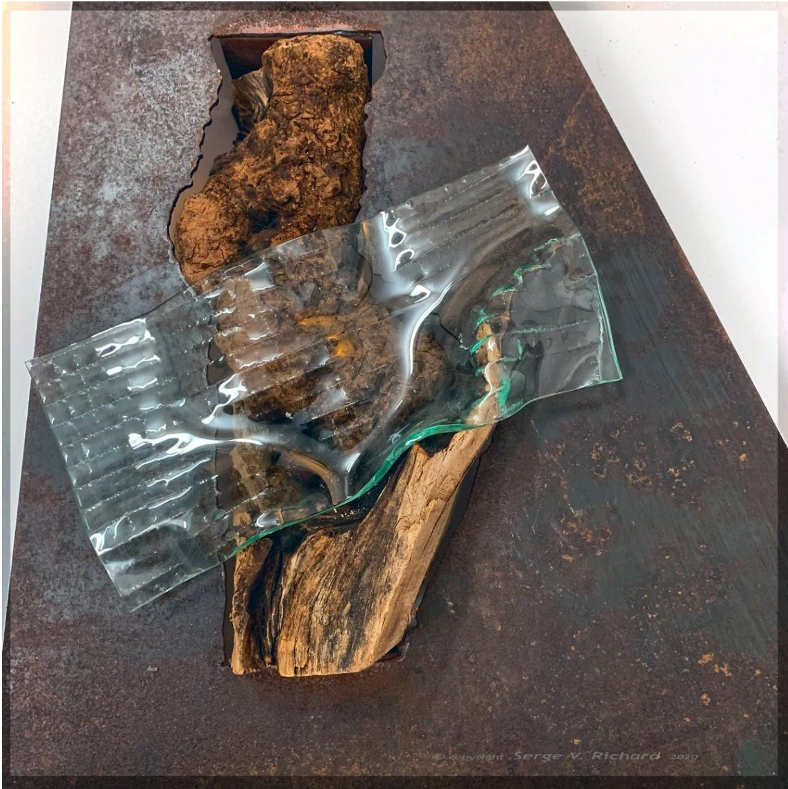
Courant d'une vie/Current in a lifetime, détails Verre, métal et bois | Glass, metal and wood. 118 cm x 62 cm x 15 cm, 202

Mes sculptures naissent souvent à l'aide de jeux et d'expérimentation. Tel un scientifique, je cherche et je combine diverses idées et objets recueillis.