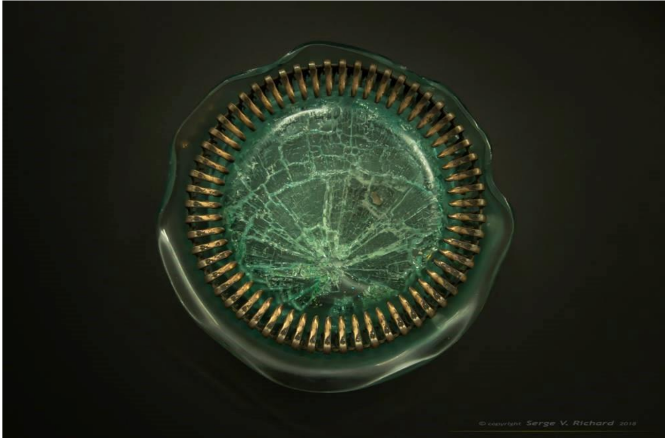
Trésor/Treasure, 24cm dia. x 5cm Verre et Acier inoxydable, 2019

Présentement, je travaille sur une série de 7 installations dont 2 sont financées par l'ARTSNB et le Conseil des Arts du Canada. L'une de ces installations ; « Prison empruntée » fut un défi pour moi, car je voulais faire de grosses œuvres en verre entourées ensuite de métal.